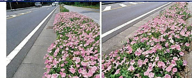
千葉県鴨川市▶ 塩害地帯だが、その影響はみられない。