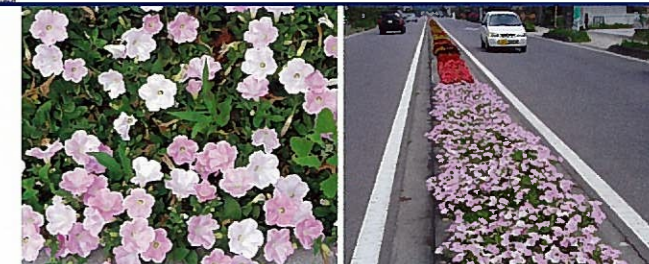
長野県軽井沢町▶ 軽井沢駅近くの分離帯に植栽。