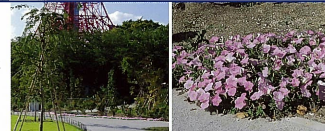
東京プリンスホテル パークタワー▶ 土を掘り下げ宴会場などを建設、その上に再度、土をもってガーデンに。