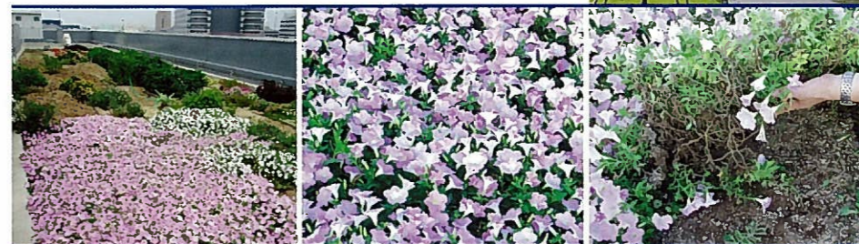
◀ 東京都大田市場の屋上花壇 海風にあたる屋上で、灌水条件も良くない環境でも旺盛な生育（越冬2夏目）。雑草抑止力を発揮。