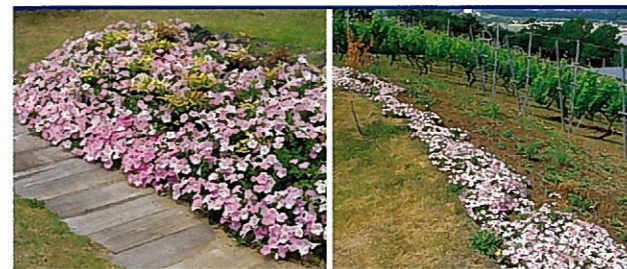
◀ 山梨県韮崎市 雪の下でも越冬（約-10℃）し、2年目の夏を迎えた。