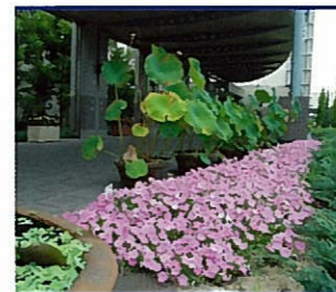
◀ 愛知県豊明市場のエントランス 花市場のエントランスに植栽。来場する花のプロたちにも人気。