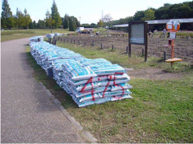
2008年10月28日 ネニエッセン type B 納品