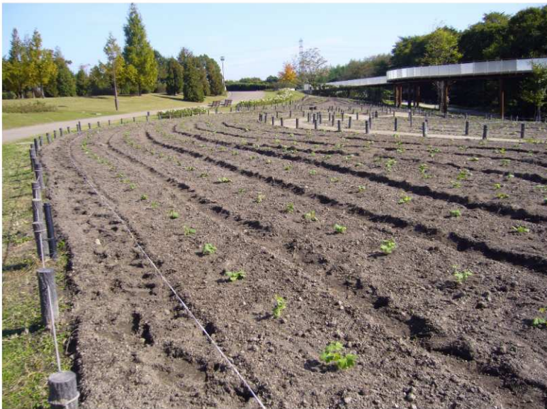
2008年11月5日 南側 花苗+播種 ネニエッセン type B 20%混合