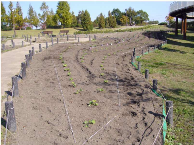
2008年11月5日 北側 花苗+播種 牛糞20%混合