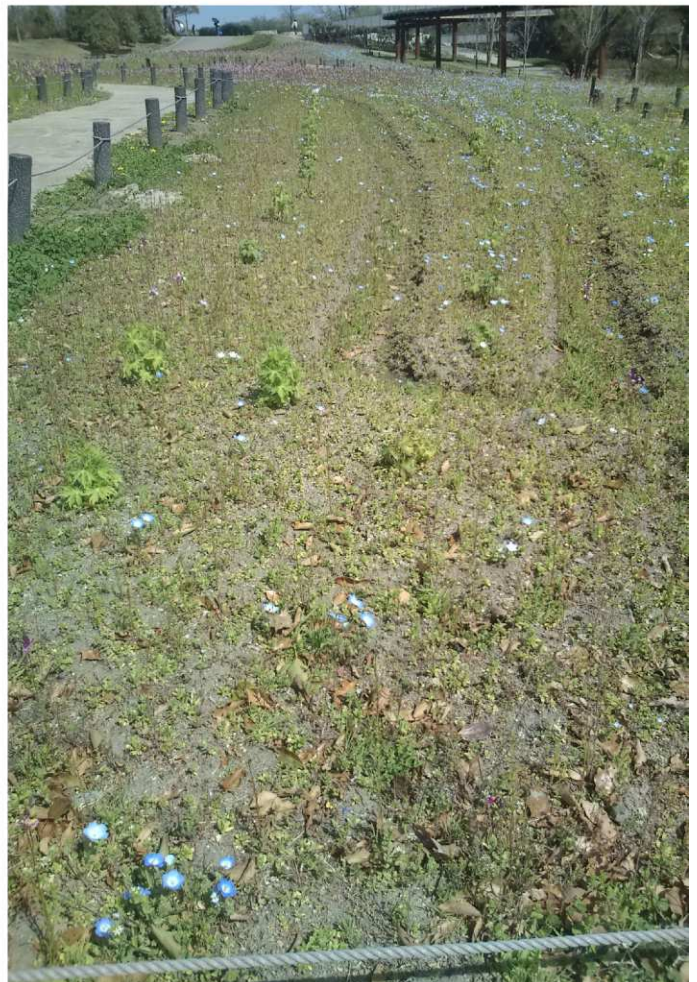
南側：ネニエッセンB20%混合区