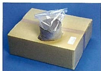
ウレタッチとプライマーの効果で、路面にシートを強力接着。端部の処理（エルタッチ）で端からの剥離を防ぎ、防草効果を長期保持。雑草の地下領域をコントロールする目地バリセメントの併用で、防草効果は更にアップ。