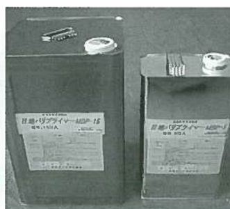
目地バリプライマー