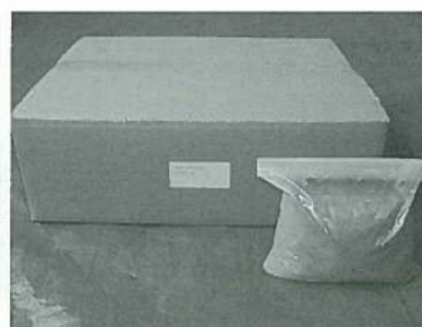
目地バリセメント