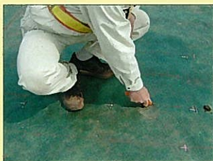
シート切り込み状況