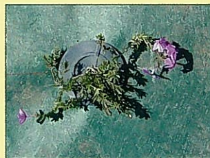
ネイルポット差し込み完了状況