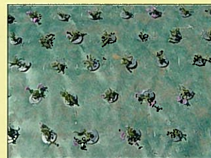
16株/m 2 施工例