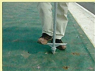
穴あけ機使用状況