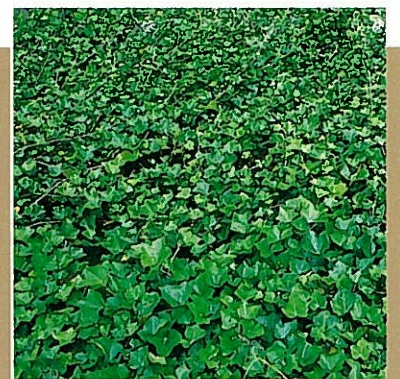
ヘデラヘリックス