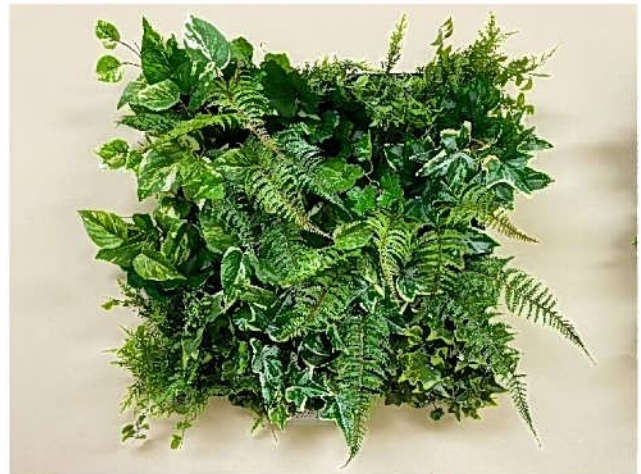
TypeB 濃淡シンプルグリーン

ヤシの葉を中心とし、赤いリーフをポイントとして使用 リゾートのような癒し空間をイメージしたデザインとなります ヤシの葉が飛び出すので厚みがありボリュームのある 仕上がりとなります