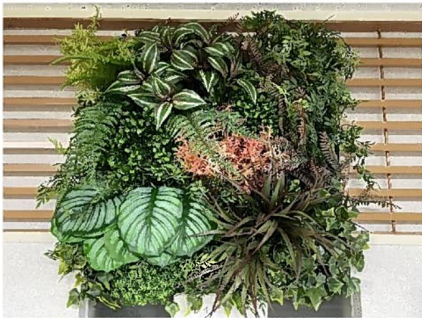
TypeA リゾートグリーン

ヤシの葉を中心とし、赤いリーフをポイントとして使用 リゾートのような癒し空間をイメージしたデザインとなります ヤシの葉が飛び出すので厚みがありボリュームのある 仕上がりとなります