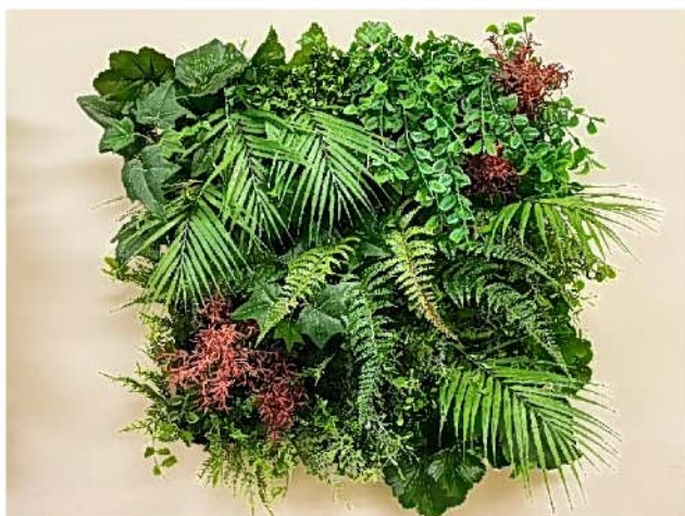
TypeC カラフルグリーン

グリーンの濃淡で作るシンプルなデザインです オフィスや商業施設のエントランスなど周りのデザインを邪魔しない 爽やかな仕上がりになります