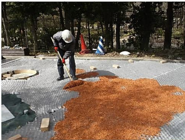
ピースマルチ敷き込みと転圧